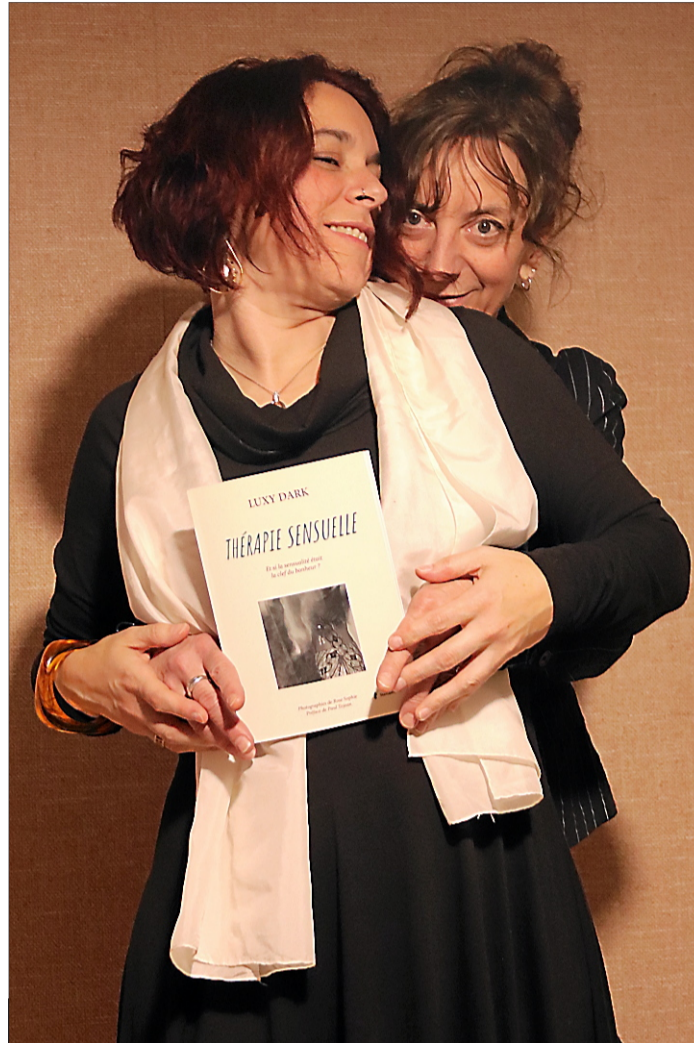
Deux femmes, deux amies et une belle complicité qui se manifeste en parfaite osmose dans le domaine de la création artistique.

D'emblée et sans aucun préjugé, la question méritait d'être posée. N'est-ce point le corps qui réclame cette liberté ; un corps libéré de toutes sortes de contrain-